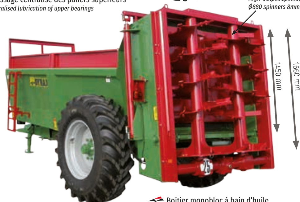
EDHV 80 avec options EDHV 80 with options