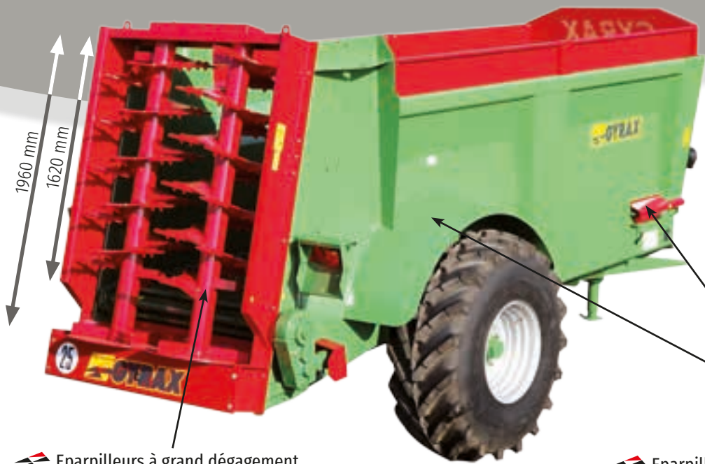
EDHV 121 avec options EDHV 121 with options

COMPACT LOW-CHASSIS SPREADERS EDHV 65-80-95-121