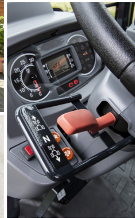
Inverseur électrohydraulique sur les modèles MF 1700 M afin d'améliorer le confort