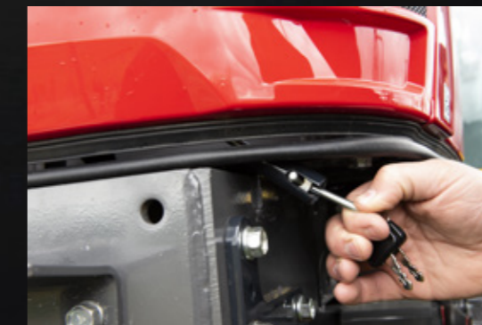
Ouverture facile du capot.

Nous avons combiné confort et style afin de garantir un entretien quotidien rapide, simple et sans stress pour vous mettre plus rapidement au travail et ainsi augmenter votre productivité et votre temps libre. Avec un tracteur Massey Ferguson MF 1500 ou MF 1700 M, le temps de préparation pour la journée de travail est minime.