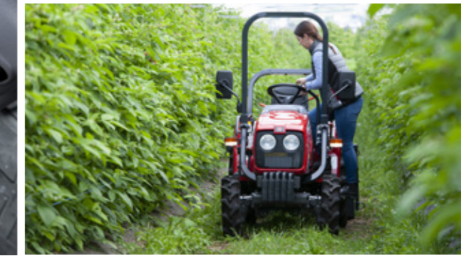
ACCÈS FACILE des deux côtés