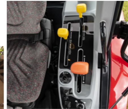
Les leviers avec un code couleur rendent l'utilisation plus simple et plus rapide des différentes fonctions : orange pour la transmission, jaune pour la PDF et grise pour le relevage et commandes hydrauliques