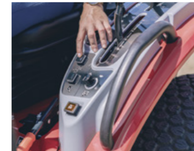
Utilisation facile avec le régulateur de vitesse

Le MF 1525 utilise une commande à double pédale, une pour chaque sens de conduite, permettant une conduite sans embrayage pour plus de confort.