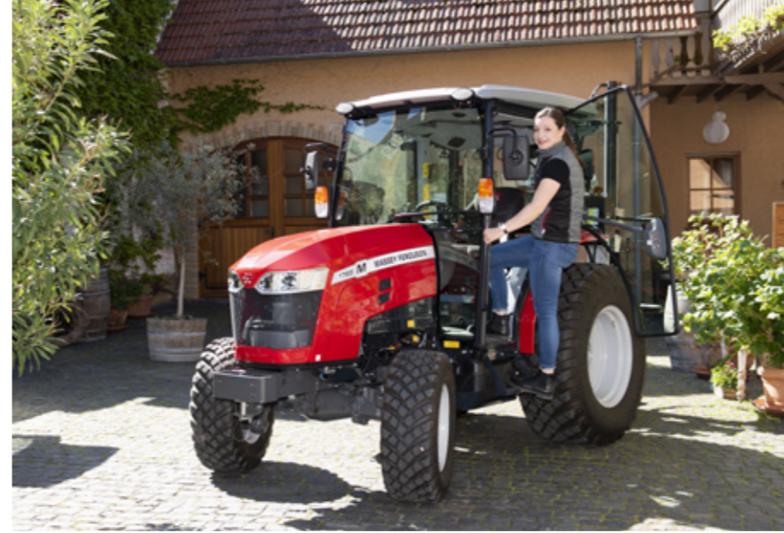
Accès facile et sûr grâce aux poignées et au marche-pied