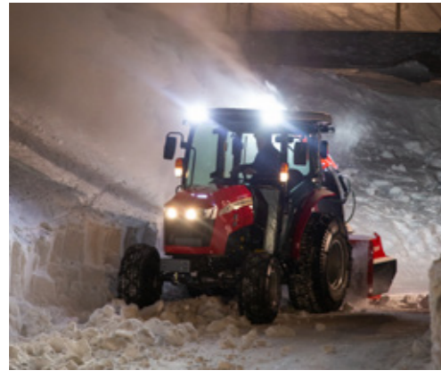
CABINE AVEC 4 FEUX DE TRAVAIL À LED – deux à l'avant et deux à l'arrière

CE SONT LES PETITS DÉTAILS QUI FONT LA DIFFÉRENCE.