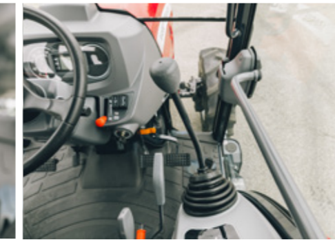
Plus de confort avec la colonne de direction inclinable et le joystick hydraulique côté droit pour un contrôle facile et précis des outils