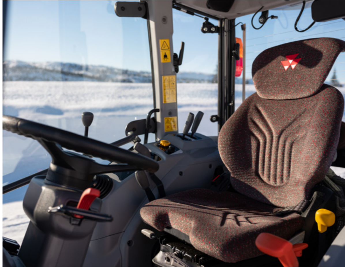
ESPACE DE TRAVAIL CONFORTABLE POUR UNE JOURNÉE PLUS PRODUCTIVE Siège à suspension pneumatique disponible en option