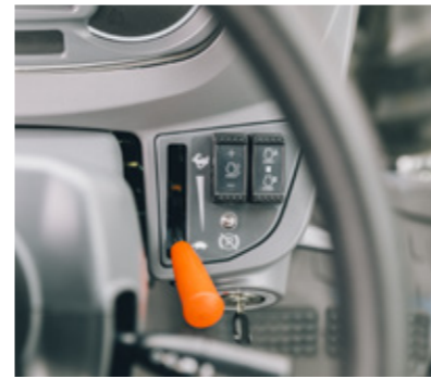
Commandes simples d'utilisation pour régler et activer le régime moteur