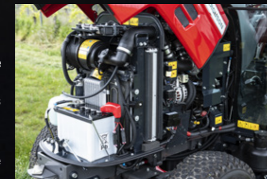
Le design du capot et du pont avant garantit un accès aisé au moteur.

Tous les produits que nous proposons ont été étudiés sous tous les angles par nos ingénieurs pour garantir un niveau maximal de compatibilité, de sécurité, de durabilité et de performance. Ils bénéficient ensuite d'un entretien par votre concessionnaire expert Massey Ferguson qui dispose de tous les outils et des connaissances nécessaires.