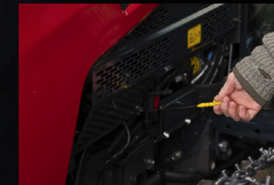
Accès simple et rapide pour l'entretien régulier.