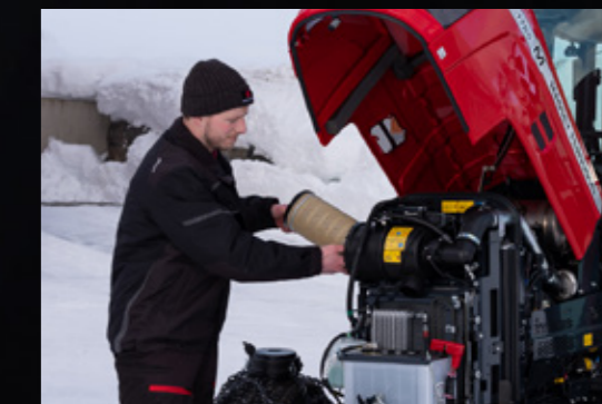
La conception du système de refroidissement garantit une facilité d'accès, de nettoyage et d'entretien. Le filtre à air moteur est également très facile d'accès pour le nettoyage.