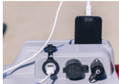
SUPPORT DE TÉLÉPHONE avec 2 ports USB et une prise 12 V