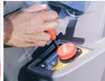
Accélérateur à main parfaitement positionné