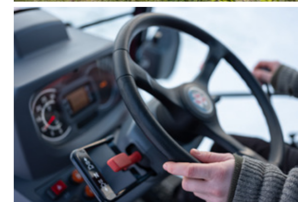
Transmission mécanique avec Power Shuttle sur les MF 1700 M - 12 vitesses avant et 12 vitesses arrière pour un maximum de confort pour chaque application.